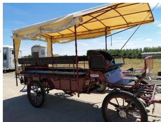
Le programme précédent a bénéficié aux Attelages de l'Érdre pour des balades en calèche accessibles à tous.

LEADER (Liaison entre Actions de Développement de l'Économie Rurale) est la déclinaison territoriale du programme de développement rural régional financé par le Fonds européen FEADER (Fonds Européen Agricole pour le Développement Rural).